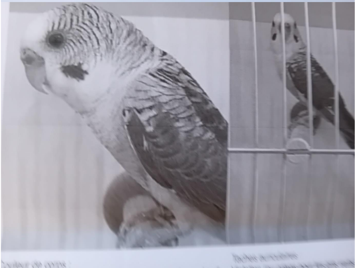
Exhibitor de 1978