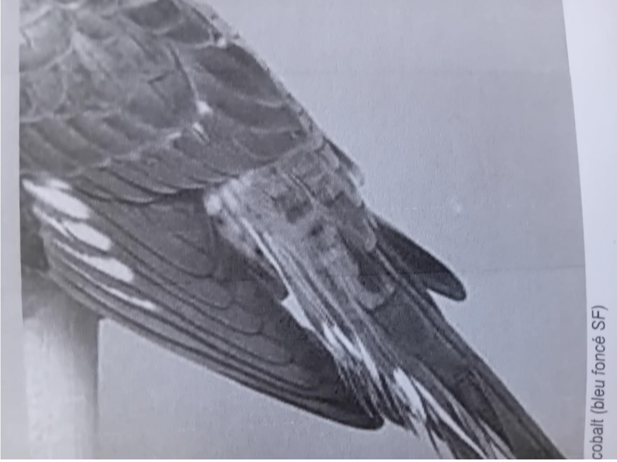
cobalt (bleu foncé SF)